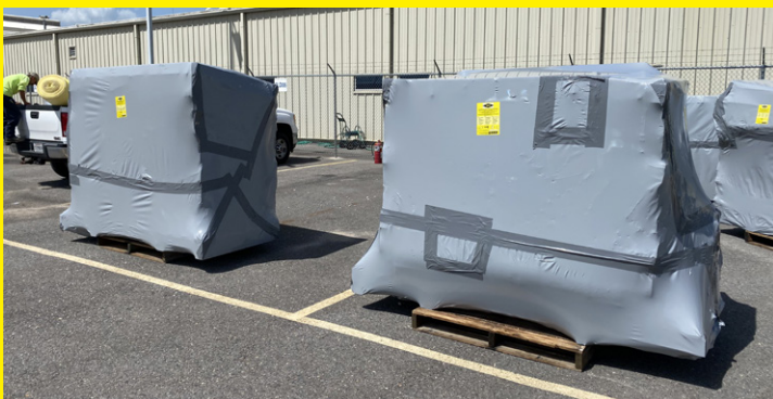
Grandes piezas de equipo envueltas con la película retráctil VCI de preservación al aire libre ICT®510-OPS de ZERUST® para almacenamiento al aire libre.

Proteja las superficies exteriores de piezas y equipos con la película retráctil VCI ICT®510-OPS y el Axxanol™ Spray-G de ZERUST®. La película retráctil VCI ICT®510-OPS proporciona protección de alta resistencia y resistente a los rayos UV, ajustándose firmemente alrededor de los objetos cuando se calienta. El Axxanol™ Spray-G es una grasa preventiva de óxido versátil, fácilmente aplicable a maquinaria y equipos para una resistencia a la corrosión a largo plazo. Ambos productos aseguran que sus activos metálicos permanezcan en condiciones óptimas, listos para su uso cuando sea necesario.