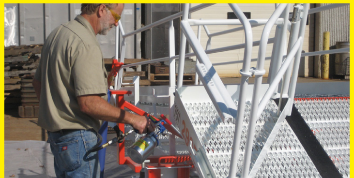
Aplicación de ZERUST® Axxanol™ Spray-G a equipos grandes para almacenamiento al aire libre, proporcionando una robusta prevención de óxido.